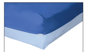
Inkl. hochwertigem PU-Vollbezug